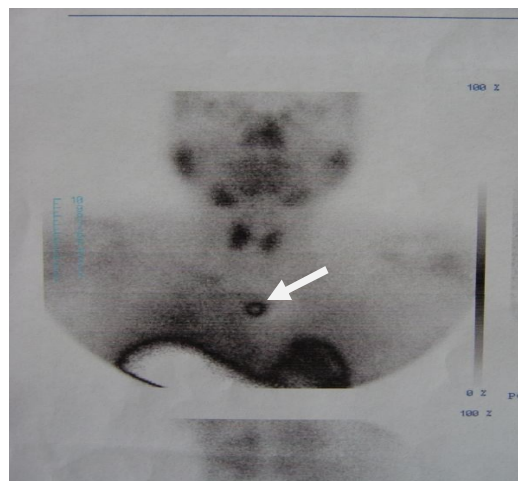
شکل ۱. اسکن سستامیبی بیمار که وجود ندول اکتویپیک پاراتیروئید را در مدياستن نشان می دهد

با توجه به این یافته ها، برای بیمار احتمال آدنوم پاراتیروئید مطرح گردید و اسکن سستامیبی پاراتیروئید با تکنیسیم ۹۹ انجام شد که یک کانون با فعالیت غیر طبیعی در مדיاستن قدامی یافت شد (شکل ۱). بیمار با تشخیص هیپرپاراتیروئیدسم اولیه ناشی از آدنوم اکتویپیک در مدياستن قدامی تحت عمل جراحی قرار گرفت. حین عمل جراحی ابتدا با انسیزیون کولار اکسپلور گردن انجام شد و با توجه به منفی بودن اکسپلور گردن و یافته های اسکن قبل از عمل، انسیزیون به T تبدیل و بررسی مدياستن قدامی انجام شد و با توجه به عدم دسترسی به توده از طریق انسیزیون گردنی استرنوتومی ناکامل (Partial sternotomy) نیز به عمل اضافه شد و تومور که در شاخ تحتانی چپ تیموس قرار داشت با انجام تیمکتومی برداشته شد. پس از عمل کلسیم و PTH به محدوده نرمال برگشت. در چند روز اول بعد از عمل بیمار هیپوکلسمی خفیفی داشت که با تجویز کلسیم خوراکی و روکاترول اصلاح گردید. در بررسی پاتولوژی آدنومی به ابعاد 2 \times 0.5 \times 0.4 cm در داخل بافت تیموس گزارش گردید (شکل ۲ و ۳).