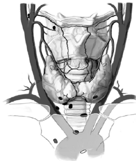
شکل ۴. محل‌های احتمالی آدنوم اکتوپیک پارائتروئید

اکتوپیک فوقانی می‌تواند در غلاف کاروتید، ناودان تراکتوازوفازیال یا مدیاستن خلفی دیده شوند (شکل ۴) (۶).