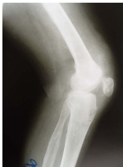
شکل 2. رادیوگرافی قبل و بعد از عمل جراحی بیمار