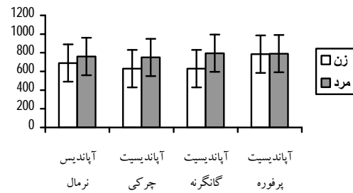
نمودار 2. مقایسه میانگین ظرفیت تام آنتی اکسیدان خون به تفکیک جنسیت و درجه پاتولوژی