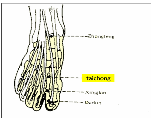
شکل 1. نقطه سوم کبدی

نقطه سوم کبدی اعمال کبد را در جریان آزادسازی انرژی و خون تنظیم می‌کند (شکل 1). هم چنین به کبد طی انبار کردن خون کمک نموده و برای درمان میگرن، اختلالات هضمی، تحریک پذیری، بی‌خوابی و مشکلات قاعدگی مورد استفاده قرار می‌گیرد (5).