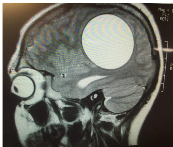
شکل ۲. تصویر کیست مغز بعد از جراحی بدون پاره شدن