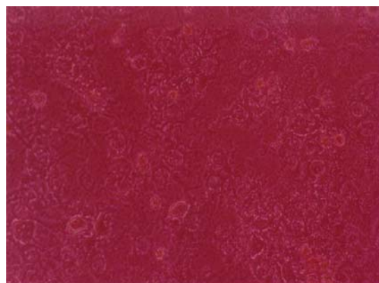
شکل ۲. سلول‌های هلا پس از تلقیح ویروس سرخک

وجود بیماری ویروسی در منطقه تومورال الگوهای متداول و مشخص حساسیت سلولی را تحت تأثیر قرار می‌دهد و تأثیرات مشاهده شده بسته به غلظت آلودگی در نوسان هستند. چنین شرایطی در بیماری‌هایی نظیر سرطان دهانه رحم که اغلب مورد تهاجم ویروس پاپیلوما هستند رخ می‌دهد. البته باید توجه داشت که در یک موجود زنده آلودگی به ویروس به صورت منطقه‌ای نیست و معمولاً در یک بیماری ویروسی تمام سلول‌های بدن تحت تأثیر ویروس قرار خواهند گرفت که به نوبه خود حساسیت پرتوی سلول‌های سالم (به خصوص اطراف ناحیه تومورال) نیز افزایش می‌یابد. لذا در تجویز دوز اشعه به منظور درمان و از بین بردن سلول‌ها توسط رادیوتراپی، دقت به این نکته حایز اهمیت است که ابتدا تمهیداتی فراهم شود تا بیماری ویروسی درمان شده و سپس نسبت به رادیوتراپی بیمار اقدام گردد.