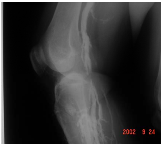
شکل ۲. ونوگرافی به عمل آمده از بیمار از ورید پوبلیته و علامت cut-off که به صورت filling defect مشهود می باشد

تمامی بررسی های خونی و تست های ANA، Anti-DNA، CRP، ESR، RF، PTT، PT، VDRL، ایمنو الکتروفورز سرم بیمار، سطوح کمپلمان های خونی، فاکتور ۵ لیدن و بررسی فاکتورهای انعقادی و سطوح پروتئین S و C و antithrombin III نرمال گزارش گردید. آزمون های خونی مربوط به سیفلیس، سیتومگالوویروس، ایدز و آنتی فسفولیپید آنتی بادی منفی بوده است. بررسی کامل ادراری وی نیز نرمال بود. در بررسی های خونی و الکترولیت ها و نوار قلب و اکوکاردیوگرافی نیز هیچ گونه یافته غیر طبیعی به دست نیامده است. در ونوگرافی به عمل آمده از اندام تحتانی بیمار در ورید پوبلیته، علامت cut-off مشهود بود (شکل ۲) که حاکی از انسداد نسبی ورید می باشد. در نمونه برداری از ضایعات پوستی بیمار ارتشاح WBC گزارش گردید (شکل ۳). در بررسی تصاویر MRI که از مغز بیمار به عمل آمده، درگیری منتشر مغز به صورت آتروفی جنرالیزه و انفارکشن در مسیر شریان مغز میانی سمت راست مشاهده گردید (شکل ۴).