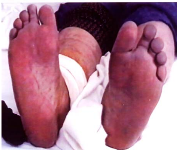
شکل ۱. ضایعات لویدورتیکولاریس در اندام تحتانی

یک خانم ۴۰ ساله به دنبال ضعف در اندام سمت چپ و دیزآرتری به همراه ضایعات پوستی لویدورتیکولاریس از سرویس داخلی به بخش نورولوژی معرفی گردید. در معاینات سیستمیک که از بیمار به عمل آمد، کبد و طحال اندازه های نرمال داشته، سوفل قلبی سمع نشد و در سطح پوست بیمار (اندام تحتانی) ضایعات لویدورتیکولاریس مشهود بود (شکل ۱). ضایعات مذکور حاشیه فعال نداشت.