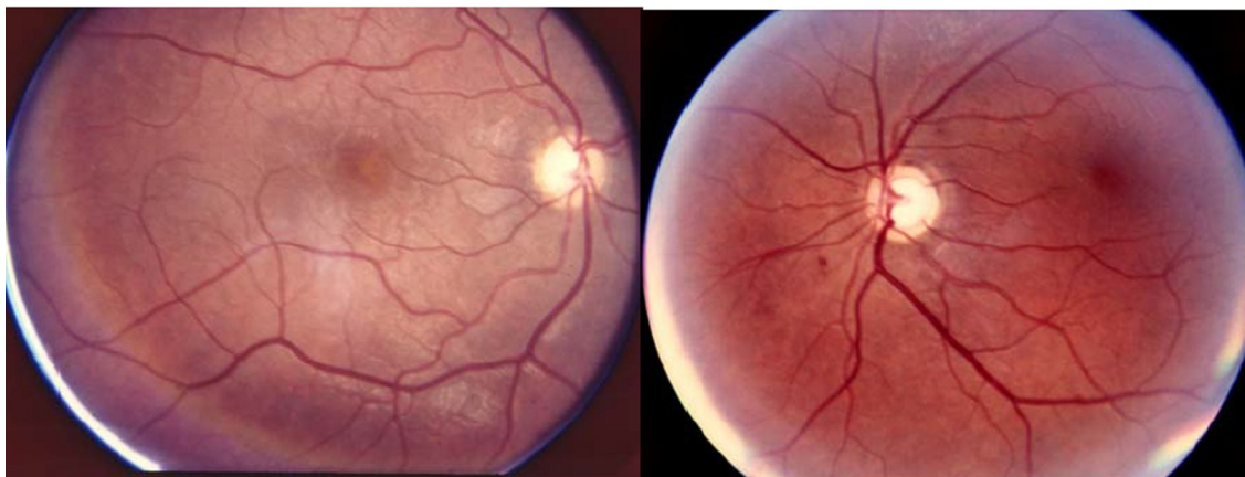
شکل 3. عکس فوندوس، آتروفی دیسک دو چشم را نشان می دهد

(Confrontation) به شدت محدود بود (تصویر 3). کنترل عفونت ریوی و اصلاح قند خون انجام و بیمار از بخش مراقبت های ویژه خارج و به بخش داخلی منتقل گردیده و بعد از سه هفته با حال عمومی خوب ترخیص شد.