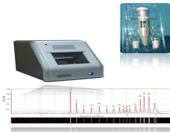
شکل ۱. دستگاه کیلاری الکتروفورز تمام اتومات (USA)Bioptic Q Sep100 DNA Fragment Analyser

را داخل دستگاه قرار داده و پس از آن نمونه‌ها را داخل دستگاه قرار داده و دستگاه را روشن می‌کنیم. نتایج آنالیز را می‌توان ۶۰۰-۱۲۰ ثانیه بعد مشاهده کرد. در این تکنیک، زمانی که ژل‌ها تحت ولتاژ قرار می‌گیرند قطعات DNA به دلیل داشتن بار منفی ناشی از فسفات موجود در ساختار خود به سمت قطب مثبت حرکت می‌کنند که توسط نور لیزر که طول موج آن به ملکول فلورسنت بستگی دارد. نتایج به صورت باندهایی مشاهده می‌شوند که در آن هموزیگوت‌ها به صورت تک قله و هتروزیگوت‌ها دو قله نمایش داده می‌شوند. دستگاه دارای یک DNA سایز مارکر استاندارد نیز می‌باشد. شایان ذکر است که برای اولین بار در ایران از این دستگاه استفاده شده و از مزایای آن می‌توان به مقرون به صرفه بودن آن و دقت بالای (قدرت تفکیک ۴-۱ bp) آن اشاره کرد. در شکل‌های ۱ و ۲ اطلاعات به همراه جزئیات مربوطه ترسیم شده است.