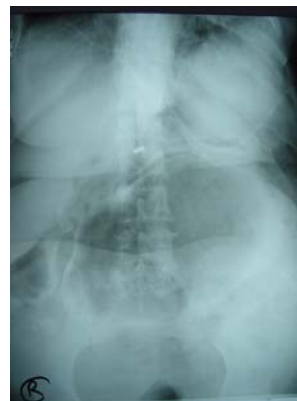
شکل ۴. گرافی ایستاده شکم (بیمار دوم)

شکل ۳ و ۴. اتساع شدید کولون همراه با هوستراسیون در گرافی ایستاده و خوابیده شکم دیده می شود. در بقیه لوپ های روده گازی مشهود نیست.