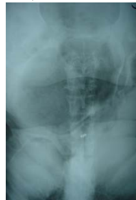
شکل ۳. گرافی خوابیده شکم (بیمار دوم)

و فشار خون 120/80 میلی متر جیوه. ورید گردنی در زاویه 45 درجه برجسته به نظر می رسید. در معاینه قلب، سوفل سیستولی 2/6 در کانون میترال شنیده می شد. در سمع ریه ها، رال و خس خس بازدمی در قواعد هر دو ریه قابل شنیدن بود. در معاینه شکم اتساع شدید شکمی به طور واضح در اپیگاستر قابل مشاهده بود. سمع روده ها هیپواکتیو و در لمس شکم مقاومت لمسی غیر ارادی و حساسیت عمومی وجود داشت. نتایج آزمایشگاهی نیز به صورت لکوسیتوز (لکوسیت 14400 در هر میکرو لیتر)، نوتروفیلی (نوتروفیل 70 درصد)، قند خون ناشتا 130 میلی گرم درصد میلی لیتر. سایر پارامترهای خونی در حد طبیعی بوده است. گرافی های ساده شکم در حالت ایستاده و خوابیده در شکل ۳ و ۴ ملاحظه می شود. در این بیمار سی تی اسکن انجام نشد.