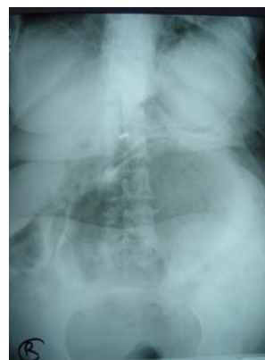
شکل ۴. گرافی ایستاده شکم (بیمار دوم)

شکل ۳ و ۴. اتساع شدید کولون همراه با هوستراسیون در گرافی ایستاده و خوابیده شکم دیده می شود. در بقیه لوپ های روده گازی مشهود نیست.