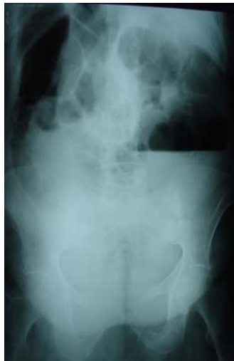
شکل ۱. گرافی ساده ایستاده شکم. قوس روده خیلی متسع زیر دیافراگم چپ دیده می شود (بیمار اول)