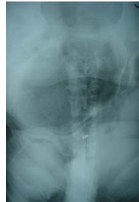
شکل ۳. گرافی خوابیده شکم (بیمار دوم)

و فشار خون 120/80 میلی متر جیوه. ورید گردنی در زاویه 45 درجه برجسته به نظر می رسید. در معاینه قلب، سوفل سیستولی 2/6 در کانون میترال شنیده می شد. در سمع ریه ها، رال و خس خس بازدمی در قواعد هر دو ریه قابل شنیدن بود. در معاینه شکم اتساع شدید شکمی به طور واضح در اپیگاستر قابل مشاهده بود. سمع روده ها هیپوآکتیو و در لمس شکم مقاومت لمسی غیر ارادی و حساسیت عمومی وجود داشت. نتایج آزمایشگاهی نیز به صورت لکوسیتوز (لکوسیت 14400 در هر میکرو لیتر)، نوتروفیلی (نوتروفیل 70 درصد)، قند خون ناشتا 130 میلی گرم درصد میلی لیتر. سایر پارامترهای خونی در حد طبیعی بوده است. گرافی های ساده شکم در حالت ایستاده و خوابیده در شکل ۳ و ۴ ملاحظه می شود. در این بیمار سی تی اسکن انجام نشد.