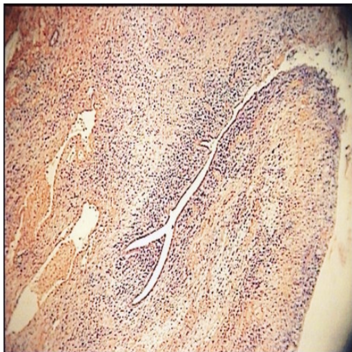
تصویر ۱. غدد خوش خیم در زمینه استرومای سارکوماتوس رحمی؛ نشان دهنده آدنوسارکومای رحم (رنگ آمیزی هماتوکسیلین-ئوزین، بزرگنمایی ۱۰۰ X)

درگیری نئوپلاستیک تا میومتر سطحی دیده شد ولی سرویکس و ضمامم دو طرف درگیری نئوپلاستیک نداشتند. یافته های فوق با آدنوسارکوم رحمی حاوی عناصر هتروولوگ از جنس غضروف مطابقت داشت.