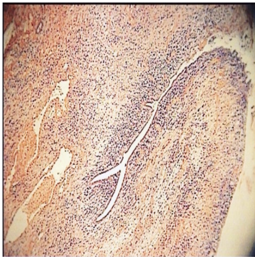
تصویر ۱. غدد خوش خیم در زمینه استرومای سارکوماتوس رحمی؛ نشان دهنده آدنوسارکومای رحم (رنگ آمیزی هماتوکسیلین-ائوزین، بزرگنمایی ۱۰۰ X)

درگیری نئوپلاستیک تا میومتر سطحی دیده شد ولی سرویکس و ضمامم دو طرف درگیری نئوپلاستیک نداشتند. یافته های فوق با آدنوسارکوم رحمی حاوی عناصر هتروولوگ از جنس غضروف مطابقت داشت.