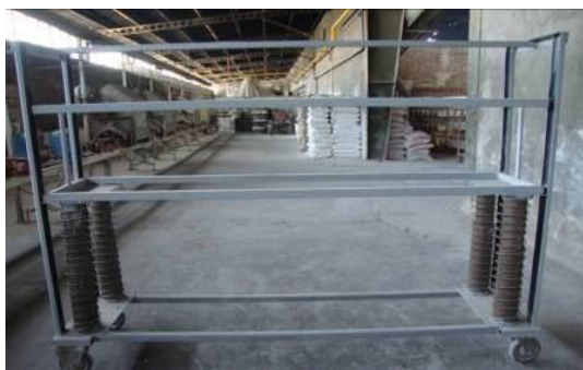
شکل 1. چرخ حمل بار طراحی شده دارای قابلیت جا به جایی عمودی در طبقات