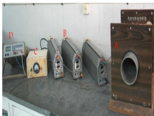
شکل ۱. سیستم مولد میدان الکترومغناطیس، A: بوبین، B: رثوستا، C: خازن، D: ولت سنج.